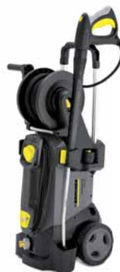
HD 6/13 CX Plus